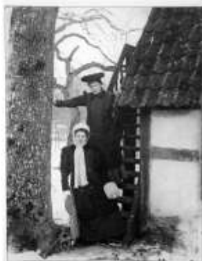
"Mazais Unguriņš" (1907.)